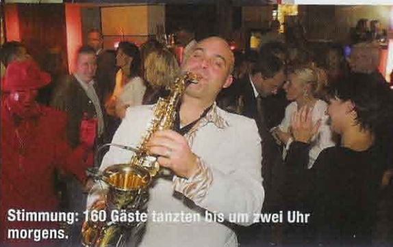
Stimmung: 160 Gäste tanzten bis um zwei Uhr morgens.