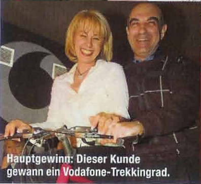
Hauptgewinn: Dieser Kunde gewann ein Vodafone-Trekkingrad.