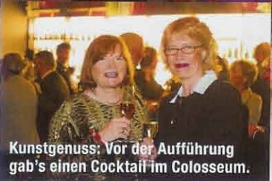
Kunstgenuss: Vor der Aufführung gab’s einen Cocktail im Colosseum.