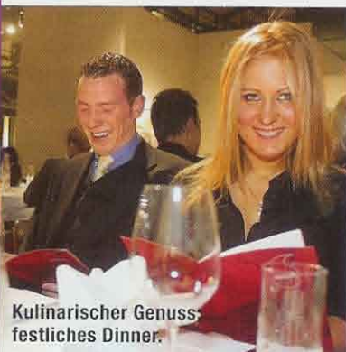
Kulinarischer Genuss: festliches Dinner.