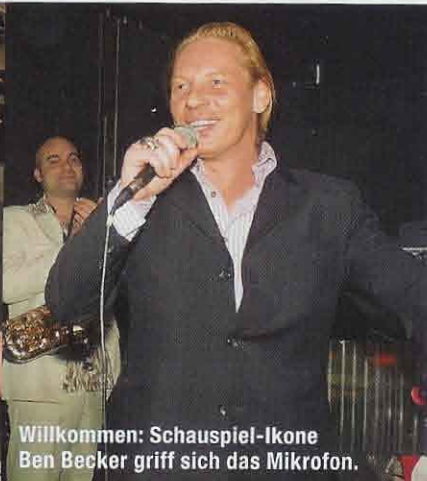
Willkommen: Schauspiel-Ikone Ben Becker griff sich das Mikrophon.